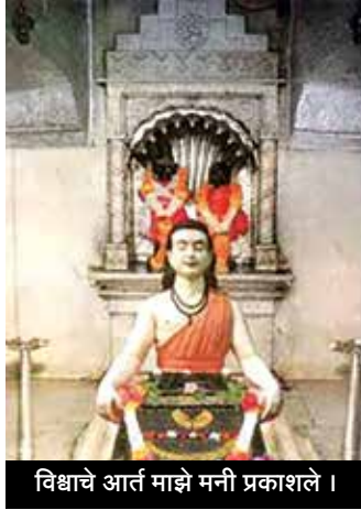
विश्वाचे आर्त माझे मनी प्रकाशले ।

दुरित म्हणजे पाप. जगातून पापाचा अंधार नाहीसा होऊन प्रत्येकाला स्वधर्माचा सूर्यप्रकाश अनुभवता यावा, ही सददिच्छा समजावून घेणे तितकेसे अवघड नाही. फक्त ज्ञानेश्वर दुरित कशाला म्हणतात, तेवढे उकलून घ्यावे लागले. पहिल्या ओळीत दुरिताला तिमिर म्हटल्यानंतर लगेच दुसऱ्या ओळीत त्यांनी स्वधर्माला सूर्य संबोधले आहे. त्यावरून दुरित शब्दाने त्यांना परधर्म अभिप्रेत असावा, असा सहज निष्कर्ष निघतो. सामान्यपणे 'धर्म' या शब्दाचा